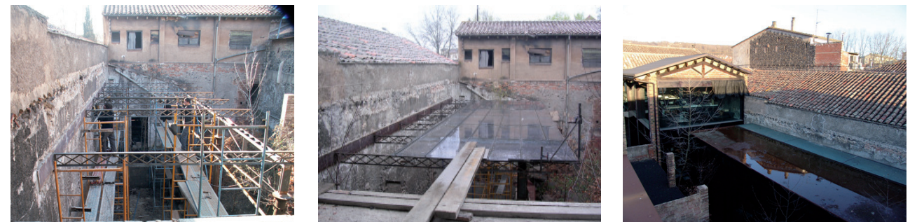
Cubierta inundada con gravas